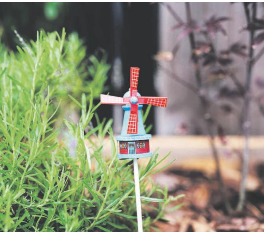
In de tuin van Astia van der Laan draait een miniatuur-molen.